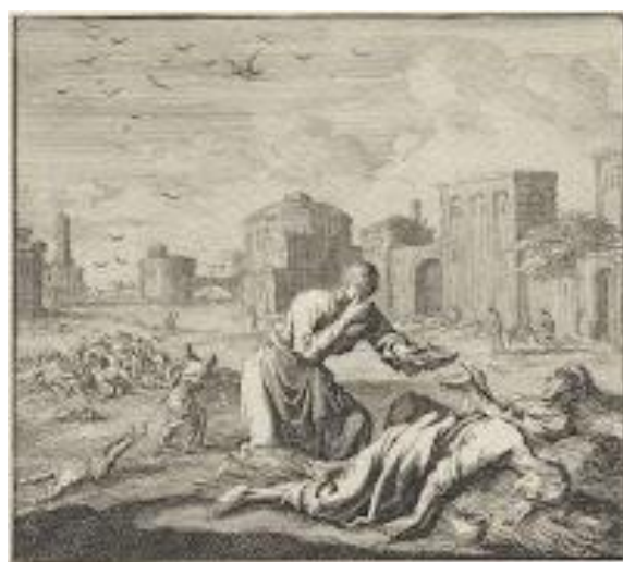
Jan Luyken, Embleem