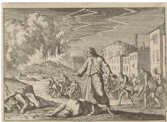
Jan Luyken, De pest in Napels 1656